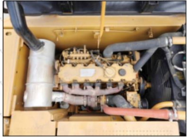
Modelo de coche a juego: Excavadora Caterpillar 320D C4.4